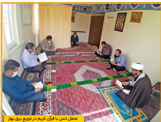
محفل انس با قرآن کریم در توزیع برق بهار

در این بازدید میدانی، مسائل و موضوعات مهم و مطرح در رابطه با روشنایی معابر شهر لالجین و چگونگی اجرای پروژه‌های این حوزه برنامه‌ریزی شد.