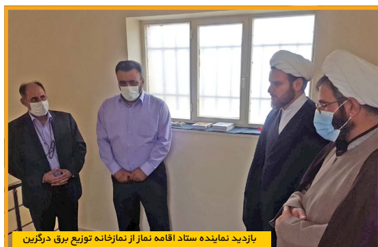
بازدید نماینده ستاد اقامه نماز از نمازخانه توزیع برق درگزین