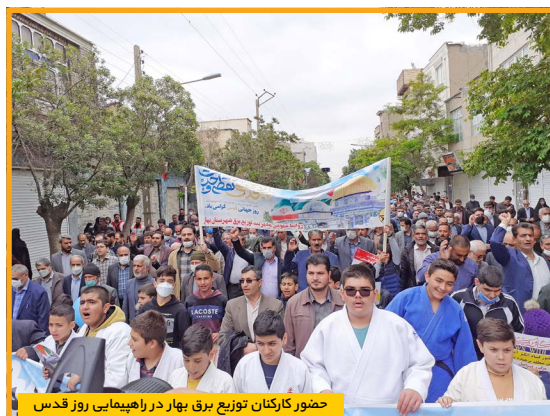
حضور کارکنان توزیع برق بهار در راهپیمایی روز قدس