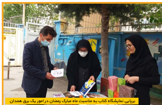
برپایی نمایشگاه کتاب به مناسبت ماه مبارک رمضان در امور برق همدان