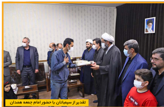
تقدیر از سیمانیان با حضور امام جمعه همدان