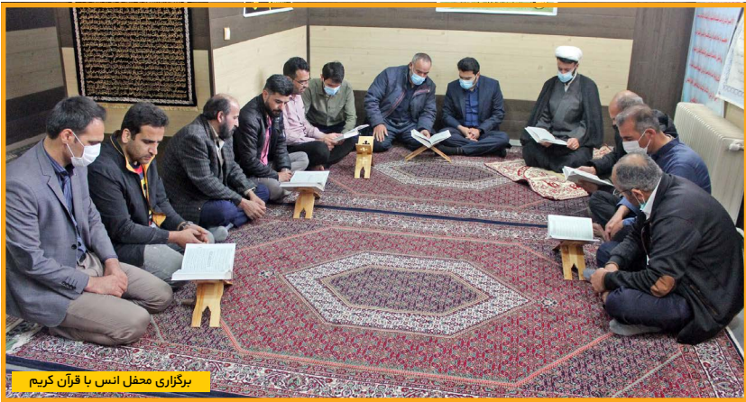
برگزاری محفل انس با قرآن کریم