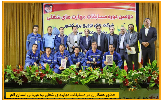
حضور همکاران در مسابقات مهارت‌های شغلی به میزبانی استان قم