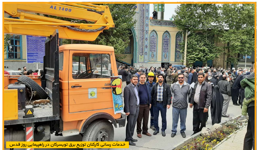
خدمات رسانی کارکنان توزیع برق تویسرکان در راهپیمایی روز قدس