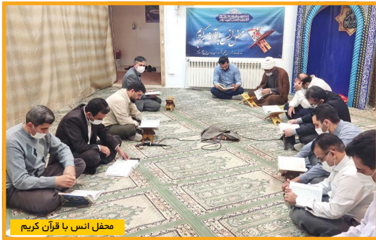
محفل انس با قرآن کریم