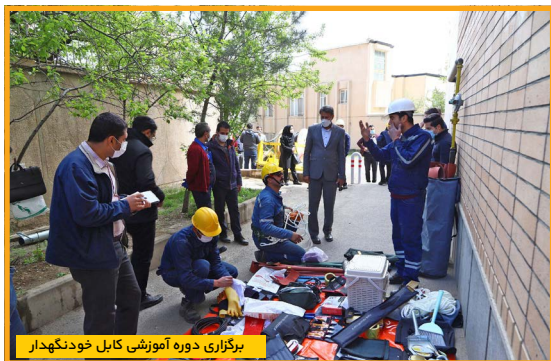
برگزاری دوره آموزشی کابل خودنگهدار