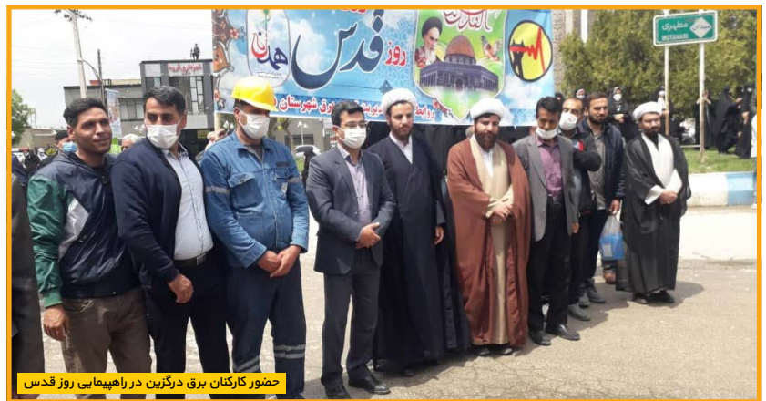
حضور کارکنان برق درگزین در راهپیمایی روز قدس