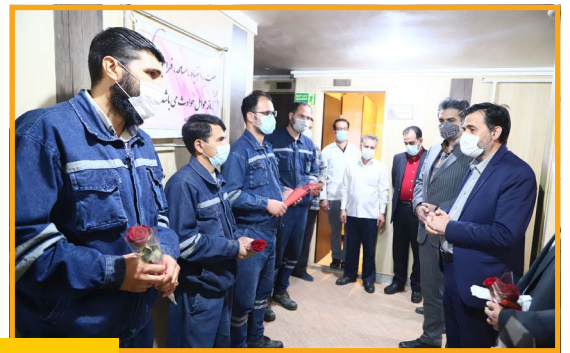
تقدیر مدیرعامل از سیمانیان به مناسبت روز سیمان