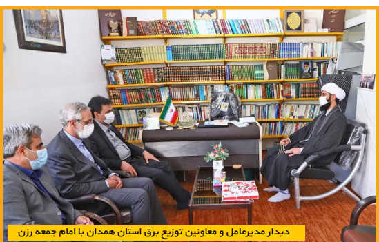
دیدار مدیرعامل و معاونین توزیع برق استان همدان با امام جمعه رزن