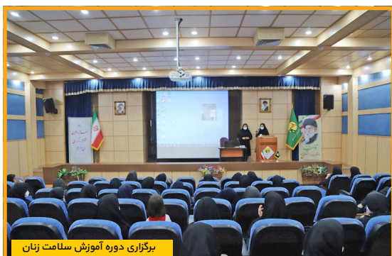
برگزاری دوره آموزش سلامت زنان