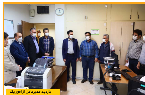
بازدید مدیرعامل از امور یک