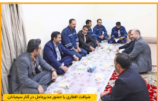
شبیافت افطاری با حضور مدیرعامل در کنار سیمانیان