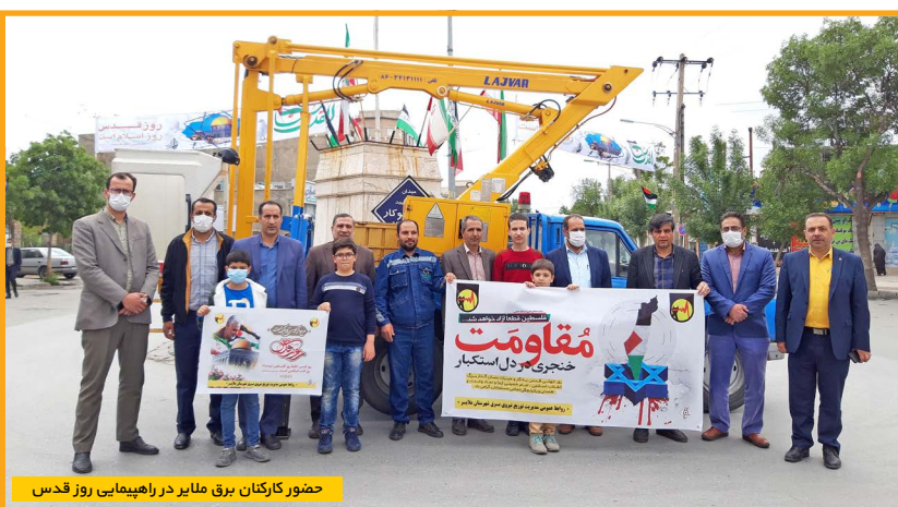
حضور کارکنان برق ملایر در راهپیمایی روز قدس