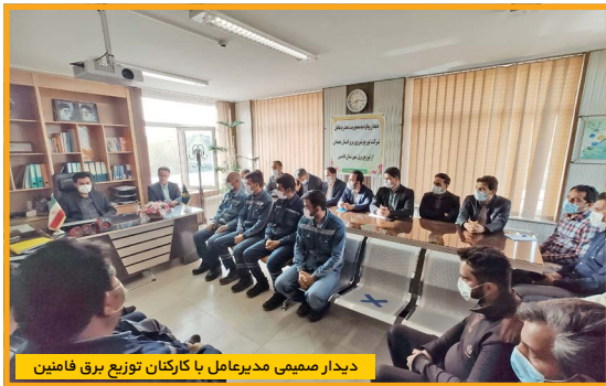
دیدار صمیمی مدیرعامل با کارکنان توزیع برق فامنین