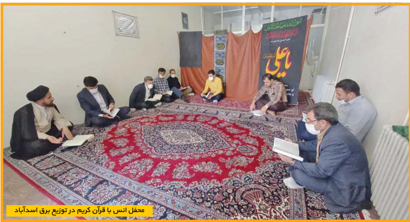
محفل انس با قرآن کریم در توزیع برق اسدآباد