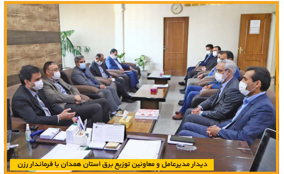
دیدار مدیرعامل و معاونین توزیع برق استان همدان با فرماندار رزن