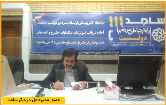
حضور مدیرعامل در مرکز سامد