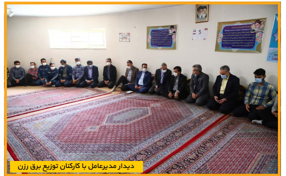
دیدار مدیرعامل با کارکنان توزیع برق رزن