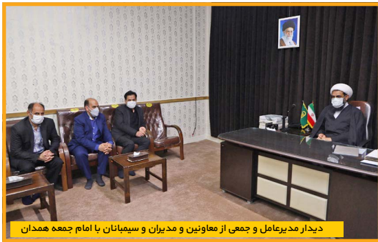
دیدار مدیرعامل و جمعی از معاونین و مدیران و سیمانیان با امام جمعه همدان