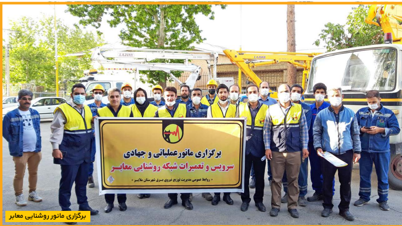
برگزاری مانور روشنایی معابر