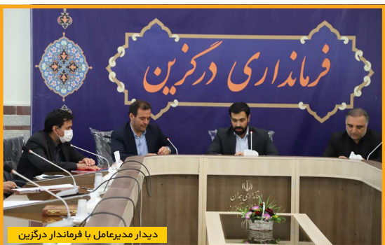
دیدار مدیرعامل با فرماندار درگزین