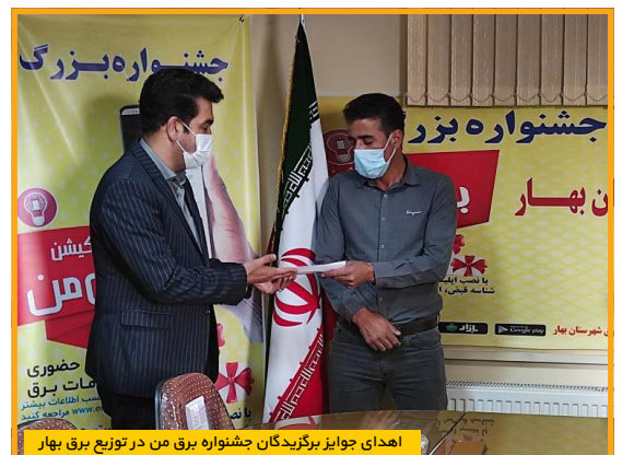
اهدای جوایز برندگان جشنواره برق من در توزیع برق بهار