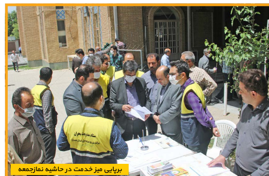
برپایی میز خدمت در حاشیه نمازجمعه