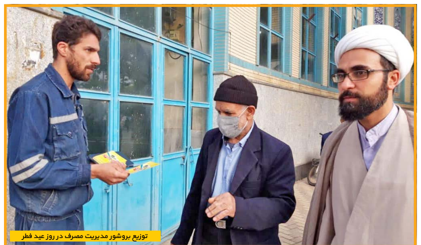
توزیع بروشور مدیریت مصرف در روز عید فطر