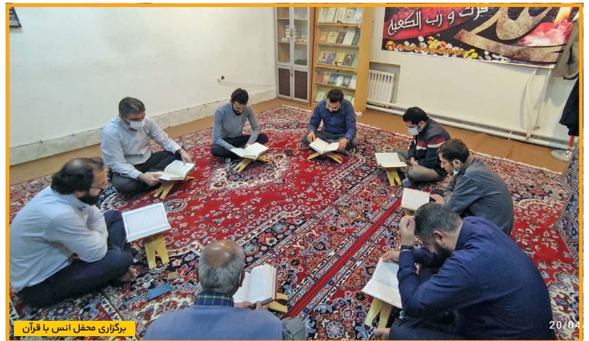
برگزاری محفل انس با قرآن