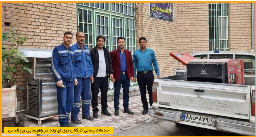
خدمات رسانی کارکنان برق نهاوند در راهپیمایی روز قدس