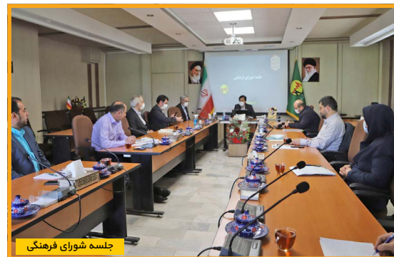
جلسه شورای فرهنگی