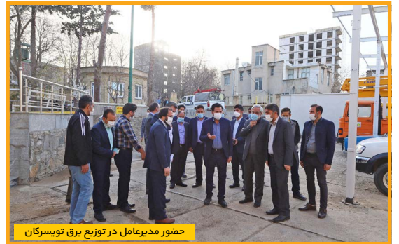
حضور مدیرعامل در توزیع برق توپسرگان