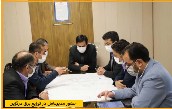
حضور مدیرعامل در توزیع برق درگزین