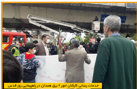
خدمات رسانی کارکنان امور برق همدان در راهپیمایی روز قدس