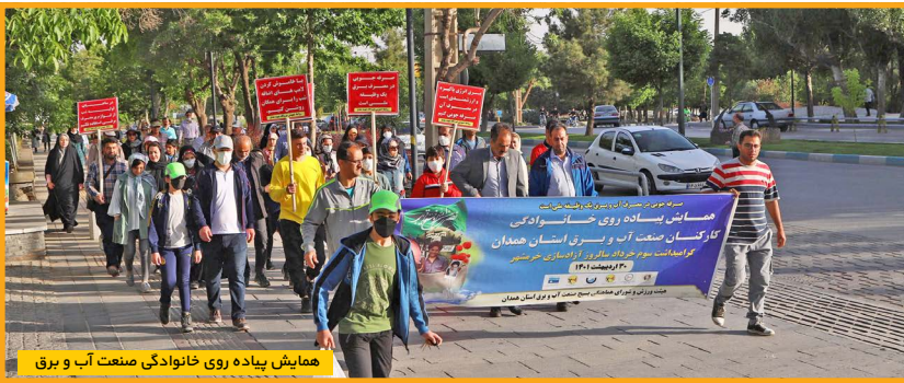
همایش پیاده روی خانوادگی صنعت آب و برق