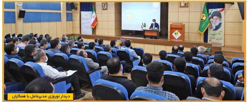
دیدار نوزدی مدیرعامل با همکاران